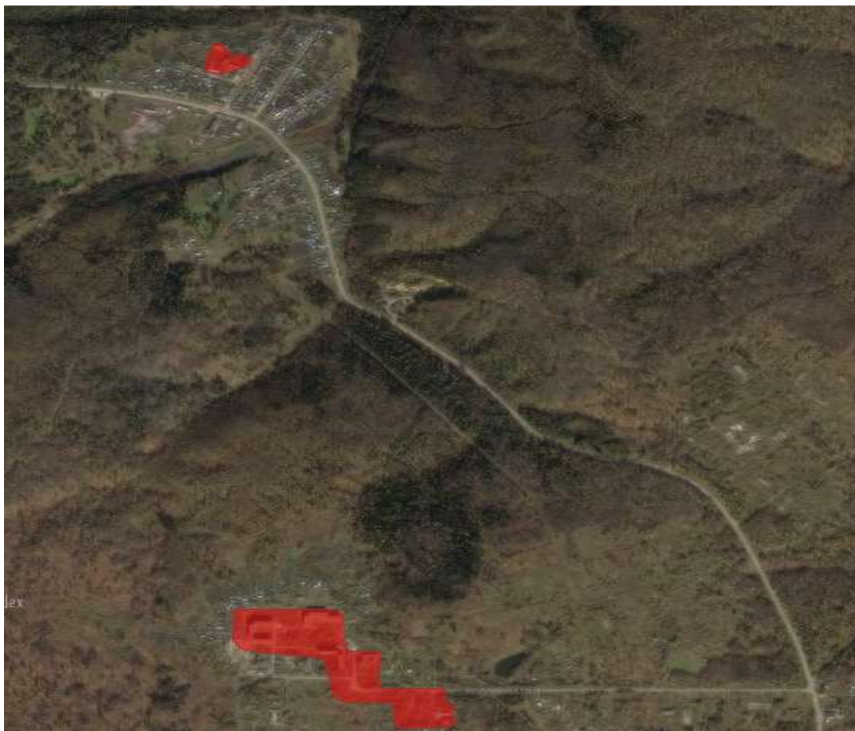
Рисунок 2.1. – Зона действия системы теплоснабжения

Зона действия системы теплоснабжения представлена на рис. 2.1